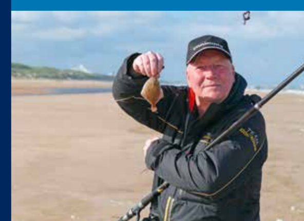
Als wedstrijdvisser laat je die puntjes niet graag liggen...

was als een biljartlaken. Tijdens die drie uur vissen wist ik ruim 9 of 10 visjes te vangen van zo rond de 10 à 11 cm. Eén clublid had die dag vier botten. En die vier van hem waren bij elkaar net een paar centimeters groter dan mijn totaal aantal centimeters. Hij werd eerste en in eindigde als Runner Up, maar... ik had wel 10 x meer lol. Ik was die dag, zoals dat zo mooi heet, aan het peuteren. Wedstrijdvisser weten dan precies