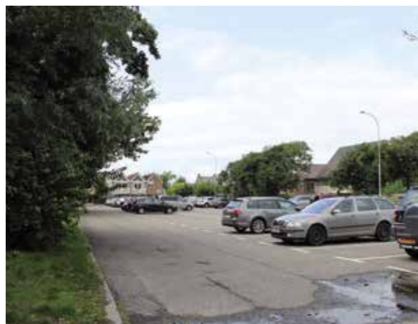
Lukt het niet direct bij de strandopgang, dan is er even verderop voldoende ruimte op dit grote parkeerterrein.

bekende houten palenrijen in volle glorie voor je en het mooie is: je kunt vrijwel op het gehele stuk vissen, zonder dat je veel last hebt van oude onderlijnen of obstakels. Behoudens dan die beruchte kleirand, maar hé: je hebt een paar loodlifters bij je en dan kan je weinig gebeuren. De stroming is hier vaak erg sterk en dus is het gebruik van een goed ankerend lood zeker aan te bevelen. De diepe vaargeul is hier vanaf ongeveer twee à drie uur vóór laag water tot twee à drie uur na laag water te bereiken. Effectief kan er hier dus bijna zeven uur gevist worden en dat is een mooie sessie. Ook buiten deze tijden valt er nog wel een visje te vangen, maar toch aanmerkelijk minder. Op deze stek is het verstandig om een sterke hoofdlijn te gebruiken; denk aan minimaal 30/00 nylon of (beter!) 16/00 gevlochten lijn. Dikker kan natuurlijk altijd. Zelf bevis ik de wijting op dit stuk strand bij voorkeur met een klassieke paternoster met drie haken boven het lood en dikke, korte haaklijnen. Deze onderlijn staat verderop in deze bijdrage uitgebreid beschreven. Voor het lood monteer je die eerder genoemde loodlift. Deze handige accessoires zijn in vele soorten en maten en maten te koop. Zelf gebruik ik er eentje met een ijzeren staafje in het midden, waardoor de constructie tijdens de worp minder gaat tollen. Houd bij dat binnen draaien behoorlijk tempo aan, waardoor de loodlift de onderlijn sneller naar het wateroppervlak kan brengen. Wanneer