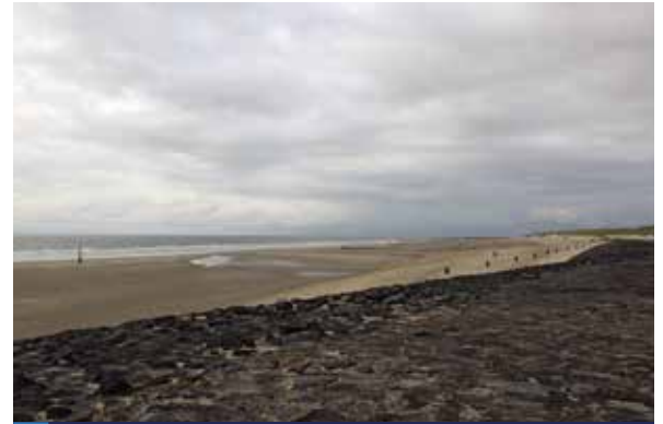
Het strand onder aan de zeedijk is vrij vlak.

langs de Noordzeekust gekenmerkt door tal van muien en zwinnen die het relatief vlakke zandstrand doorsnijden.