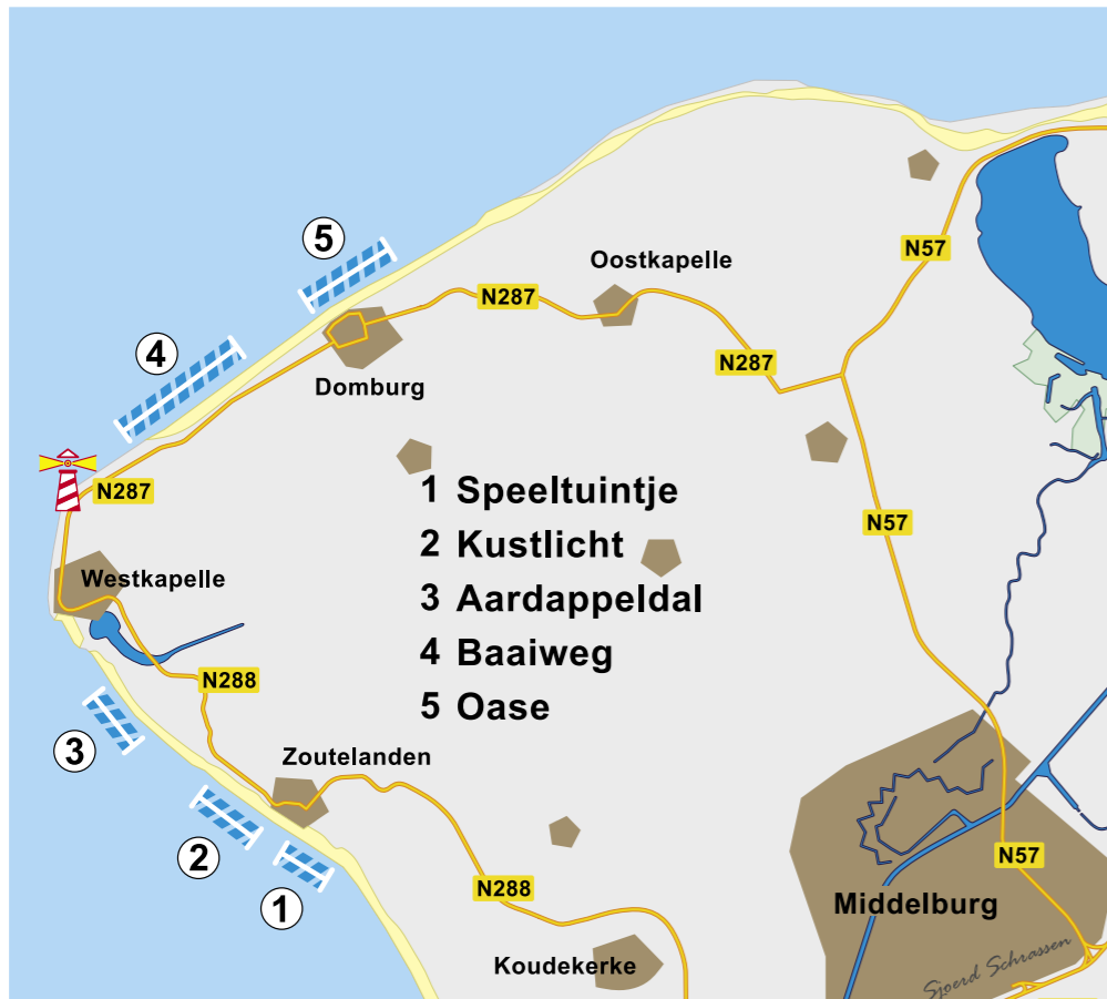
De vijf hier beschreven stekken aan de kust van het voormalige eiland Walcheren. Illustratie: Sjoerd Schrassen

je vóór je lood plaatst en die tijdens het binnen draaien zoveel opwaartse druk genereert, dat je lood snel van de bodem wordt getild. Daarover zo meer. Deze stek is vrij eenvoudig te bereiken, aangezien je buiten het strand-