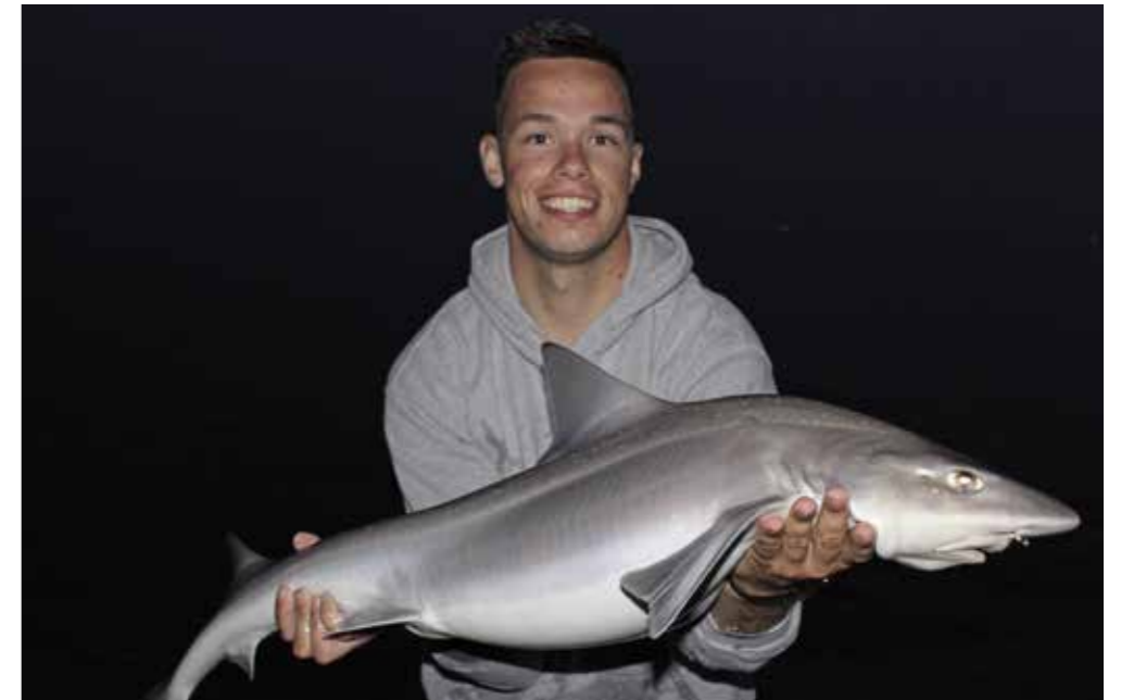
Afgelopen zomer leverde het strand Speeltuintje de nodige prachtige gevlekte gladde haaien op.

Deze stek ligt ook nabij Zoutelande, maar meer richting Westkapelle. Deze strandopgang dankt zijn naam aan de lichttoren die bovenop de dijk staat, met het doel de schepen veilig langs dit gevaarlijke stukje Zeeuwse kust te lozen. De strandopgang is gelegen aan een groot parkeerterrein met voldoende parkeermogelijkheden. Vanaf de