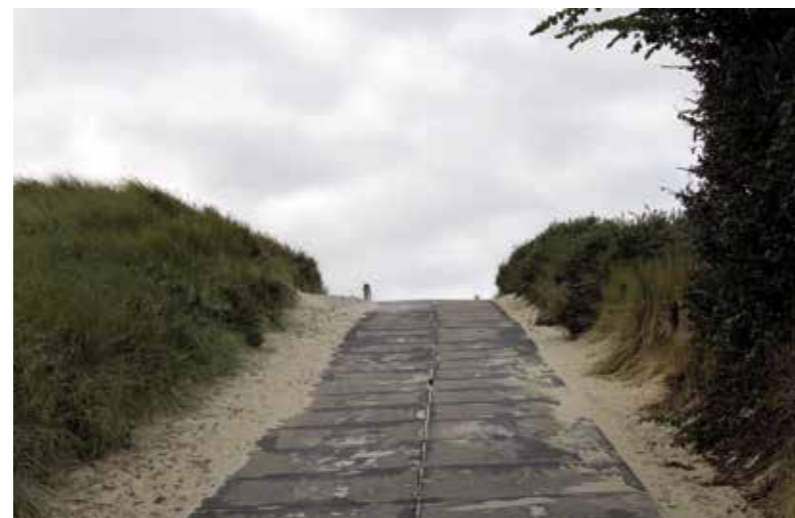
Even het duin over en dan ligt het strand in zijn volle glorie voor je!