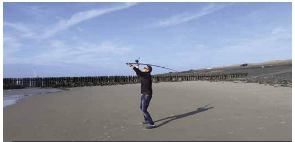
Wie vér kan werpen is hier zondermeer in het voordeel.

Er zijn hier aanmerkelijk minder surfers actief dan aan de Baaiweg, maar zelfs als er enkele surfers bezig zijn, is hier eigenlijk altijd wel een stekje te vinden waar je veilig kunt vissen. Houd ook hier je onderlijnmontage lekker simpel, met drie haken –al dan niet met afhouders– boven het lood.