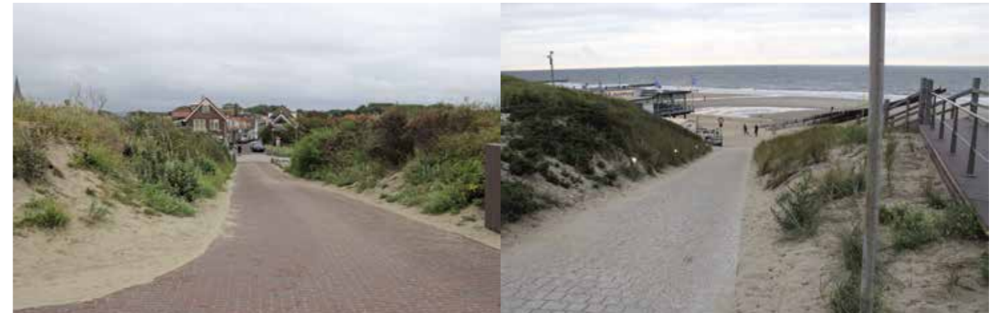
Dit strand bereik je direct vanuit de sfeervolle badplaats Domburg.

Om een 'slappe' tap goed te kunnen binden, kun je gebruik maken van de Tronixpro Baiting tool. Daarop kun je de op de haak te monteren tap prikken, om er vervolgens je haak er langs te leggen. Daarna wikkel je het elastiek een aantal keren om de haak plus tool en vervolgens trek je de tool er tussenuit. Je aas zit dan perfect op je haak en blijft er ook lang genoeg aan zitten om vis te vangen. Mits het niet barst van de hongerige krabben natuurlijk, maar van die fanatieke aasrovers heb je in de wintermaanden nauwelijks last.