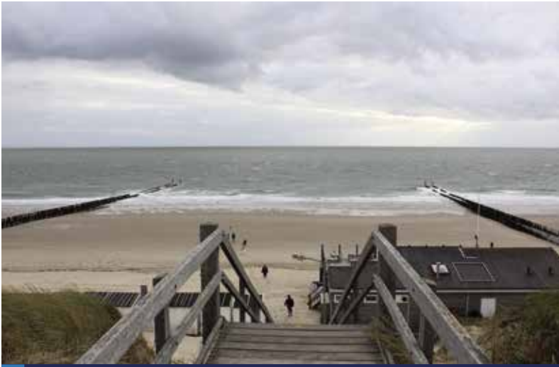
Het maakt niet uit welke kant je kiest.