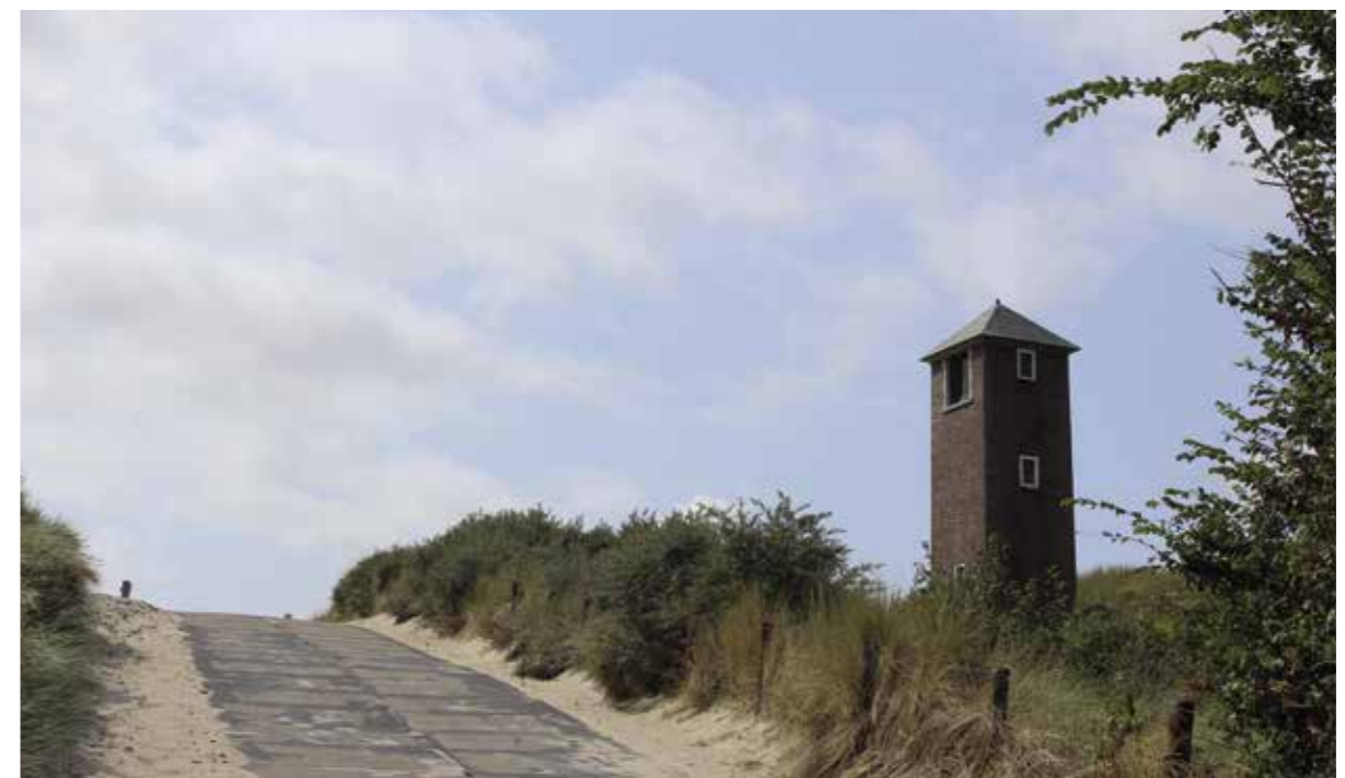
De lichttoren waaraan deze stek zijn naam dankt.

ook nog eens zo'n beetje 50/50, al zal rond deze tijd van het jaar de wijting wat meer overheersen. Het na deel van deze stek is dat er een aanzienlijke kans is dat je vast komt te zitten in de kleiranden en de daarop achtergebleven oude lijnen. Ben je daarop niet voorbereid, dan kan dat je onderlijnen gaan kosten. Gebruik ook hier dus beslist een loodlift en