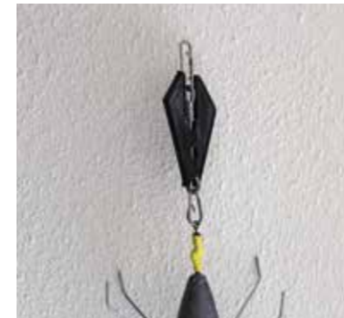
Loodlift gemonteerd boven het (anker)lood.

je ziet dat je lijn bijna uit het water komt, kun je het tempo iets verminderen, maar het beste is om niet te stoppen met draaien. Doe je dit wel, dan is er een kans dat je alsnog vast komt te zitten.